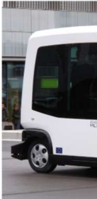
Liger og Robosoft Technologies produserer denne

General Motors investerer en halv milliard dollar i Lyft.