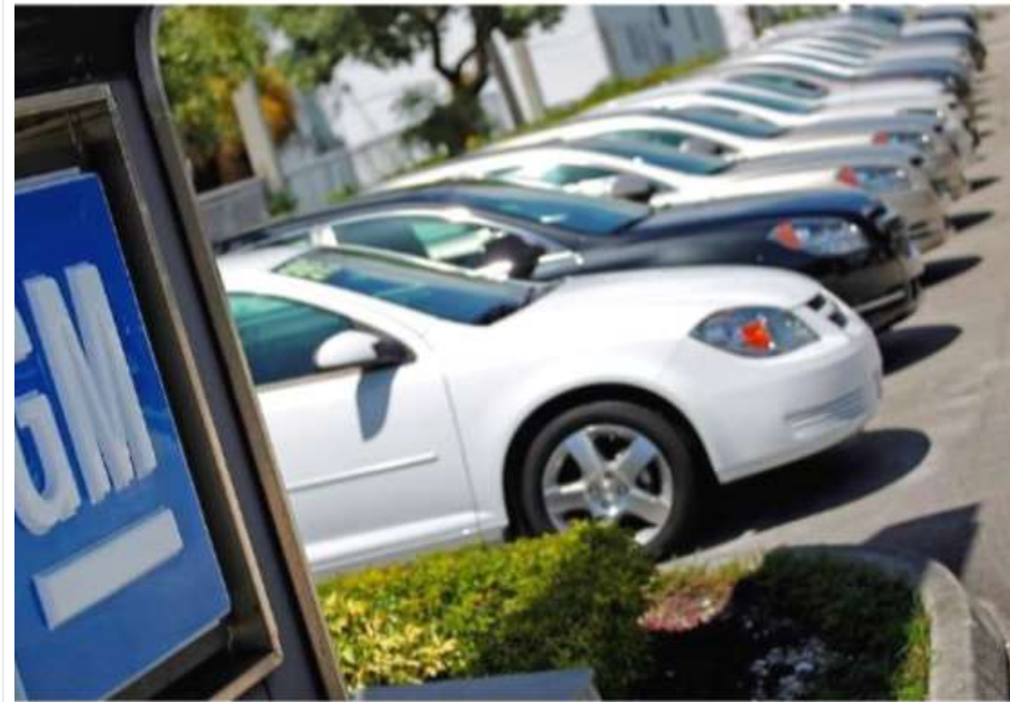
sporttjenesten Lyft.