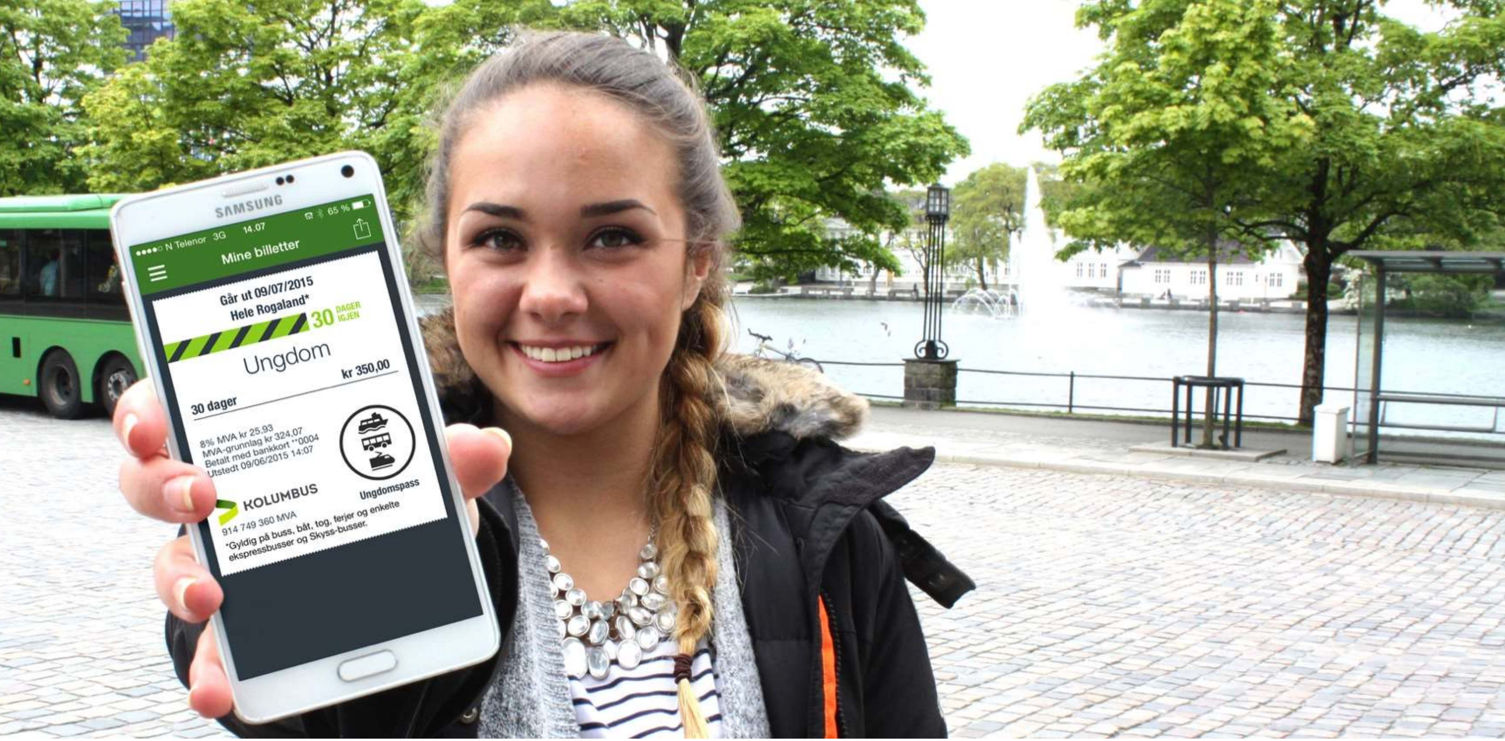
Kundene vil være selvhjulpne